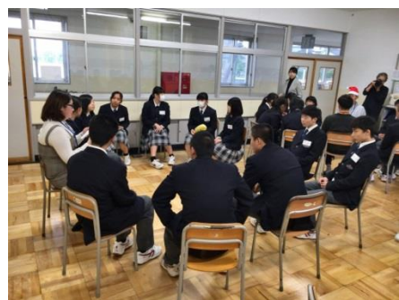
社会人講師の話聞く