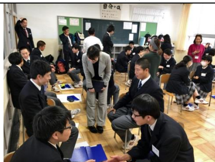
聞く活動：話す人、聞く人に分かれ、相づち、リアクションが重要なことを体験