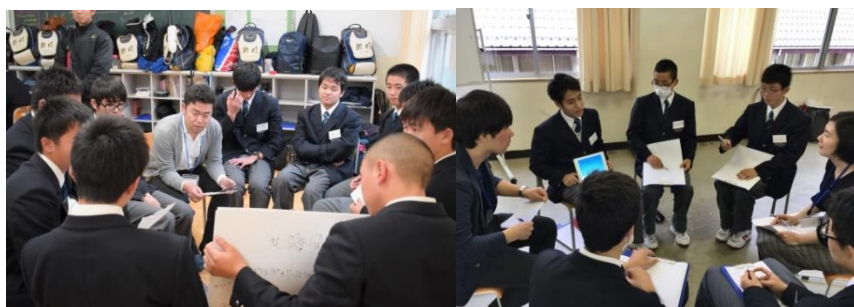
魚津市 PBL のプレゼンテーション