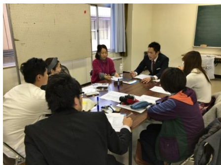
イノライブ開始前、学級担任と作戦会議

1クラス5～6名の社会人講師が教室に入り、自己紹介や聞く活動を通しながら、生徒の価値観を広げられるようなアドバイスを行っていただきました。3時間半という長い時間を使った活動で、後半、疲れが見られる生徒もいましたが、全員一生懸命に取り組んでいました。